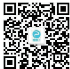
微信公众号二维码